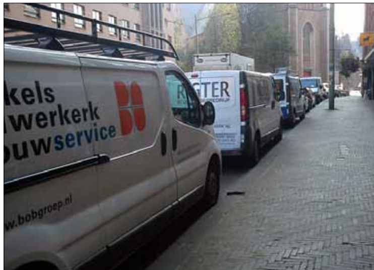
Busjes in de Torenstraat. Klussers gebruiken dit stuk straat als parkeerplaats. “Heel storend”, vinden de winkeliers langs deze route. “Het geeft een onveilig gevoel, al mensen jou en je winkel niet kunnen zien vanaf de straat en jij de straat niet kunt zien. Los daarvan is het ook ontsierend.”

Want iedereen klaagt over de afgenomen klandizie sinds de invoering van het VCP. Maar men heeft er een hard hoofd in dat de gemeente de plannen ooit zal bijstellen. En werkelijk zal luis-