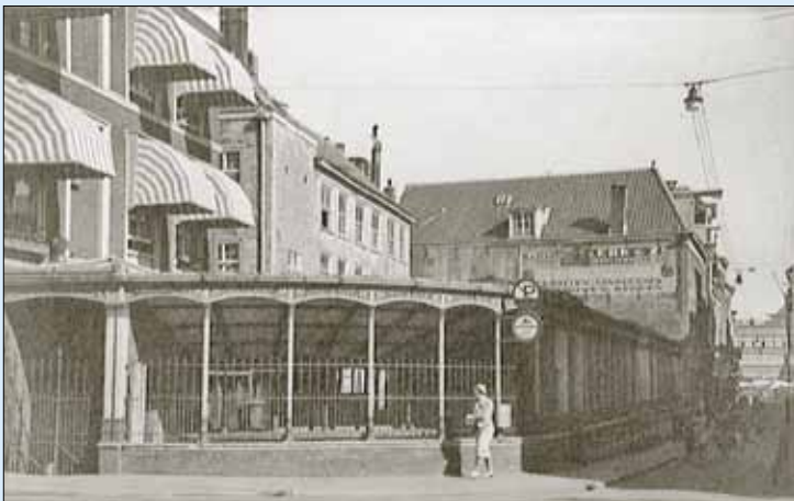
Tot in de jaren '60 stonden hier de Visbanken.