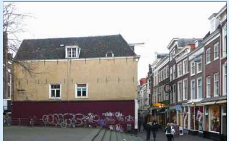
Daarna restte jarenlang slechts een blinde muur.