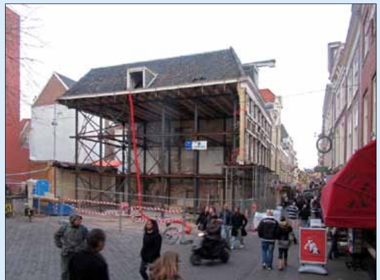
Maar vervolgens werd er stevig ingegrepen.