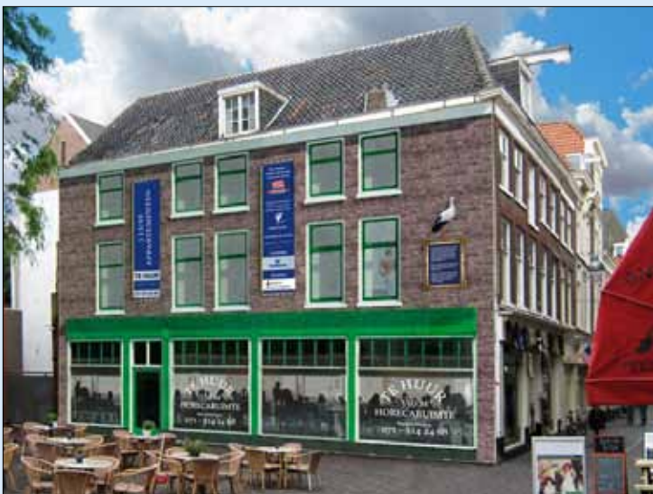
Een canvasdoek schiep alvast een (tijdelijke) illusie.