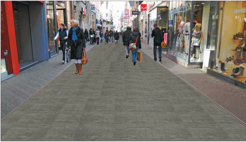
Zo ongeveer zal de Spuistraat er uit zien na de aanpak.