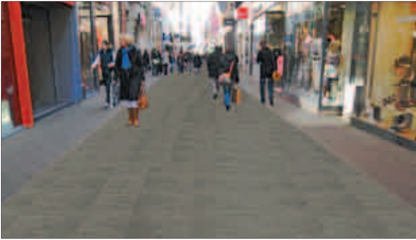
Zo ongeveer zal de Spuistraat er uit zien na de aanpak.