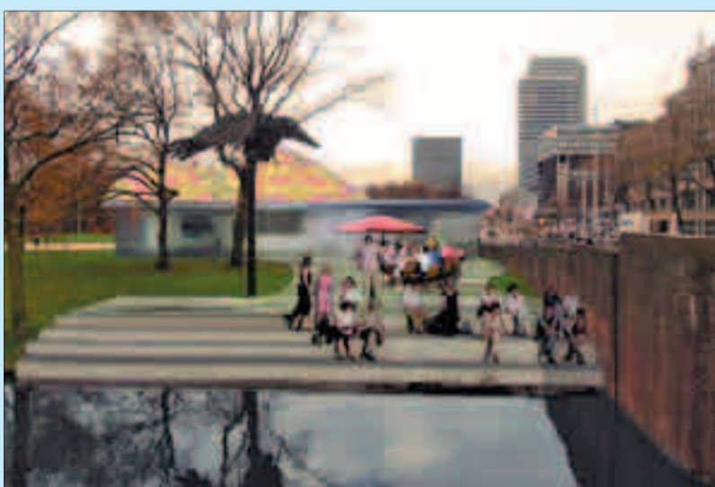
Het paviljoen tegenover de Prinsessegracht. Een van de toekomstdromen van de Ooievaart.

Dit geeft geen representatief beeld van Den Haag. Daarom heeft de Ooievaart een beeldbepalend kunstwerk van circa 36 meter breed en 24 meter hoog bedacht: een grote wereldbol, tevens fietsenstalling. "Want Den Haag is een Wereldstad van Recht en Vrede." Het belangrijkste onderdeel van de plannen is echter het realiseren van een nieuw Paviljoen bij de brug over de Herengracht, bij de transforma-