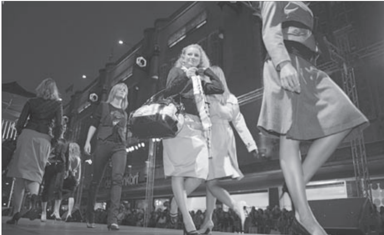
De modeshow in de Grote Marktstraat tijdens de Shoppingnight van 21 juni vorig jaar. Als de winkeliers hun beste beentje voorzetten kan het ook op 19 juni van dit jaar weer een reuzesucces worden.

Ruim 300 bezoekers bezochten het congres, dat werd bezocht door gemeenteambtenaren, winkeliers, hoteliers en ondernemers uit de binnenstad, actieve binnenstadbewoners, KvK-medewerkers en marketingspecialisten.